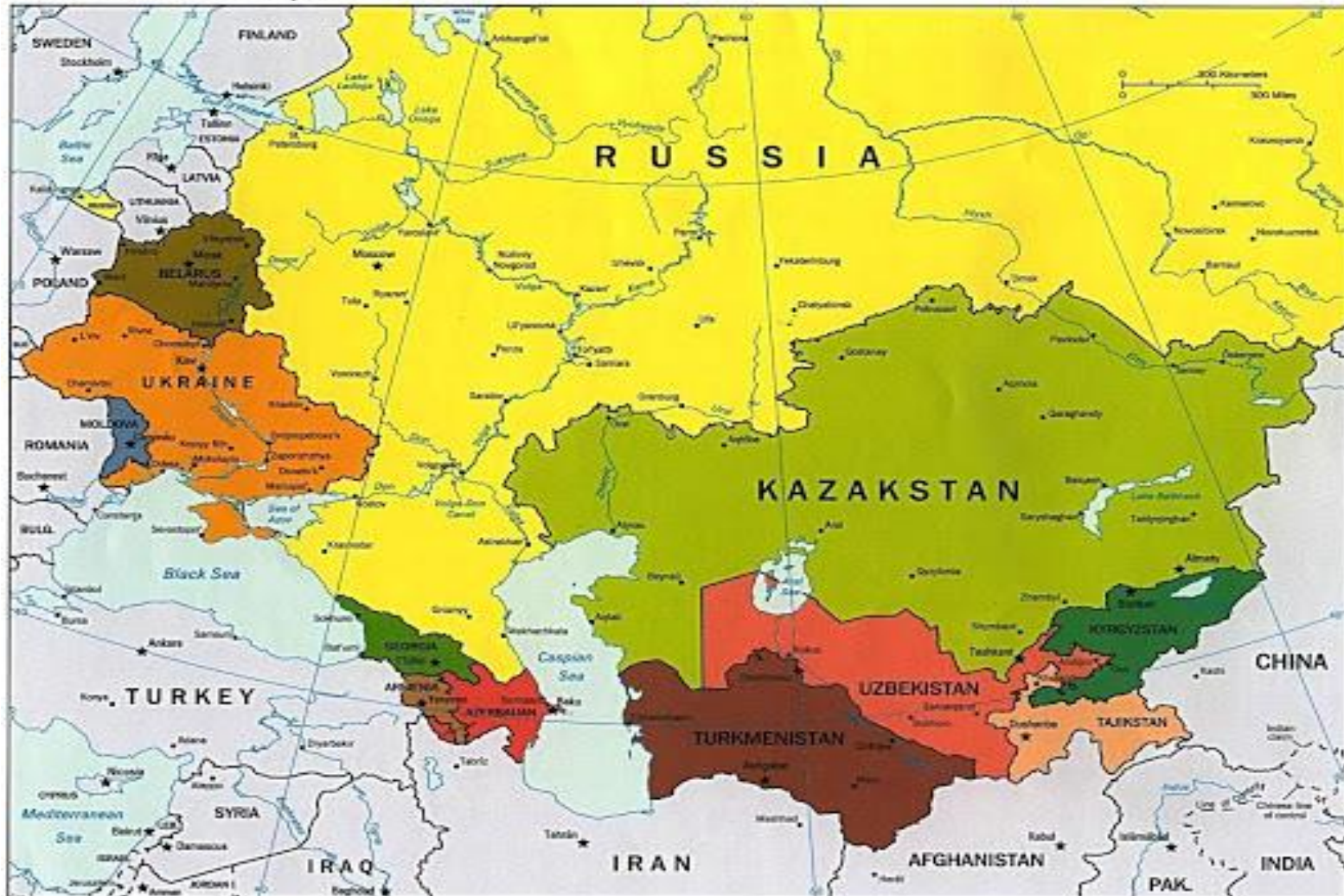
Commonwealth of Independent States